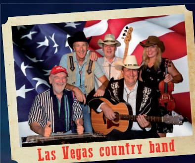
Las Vegas country band