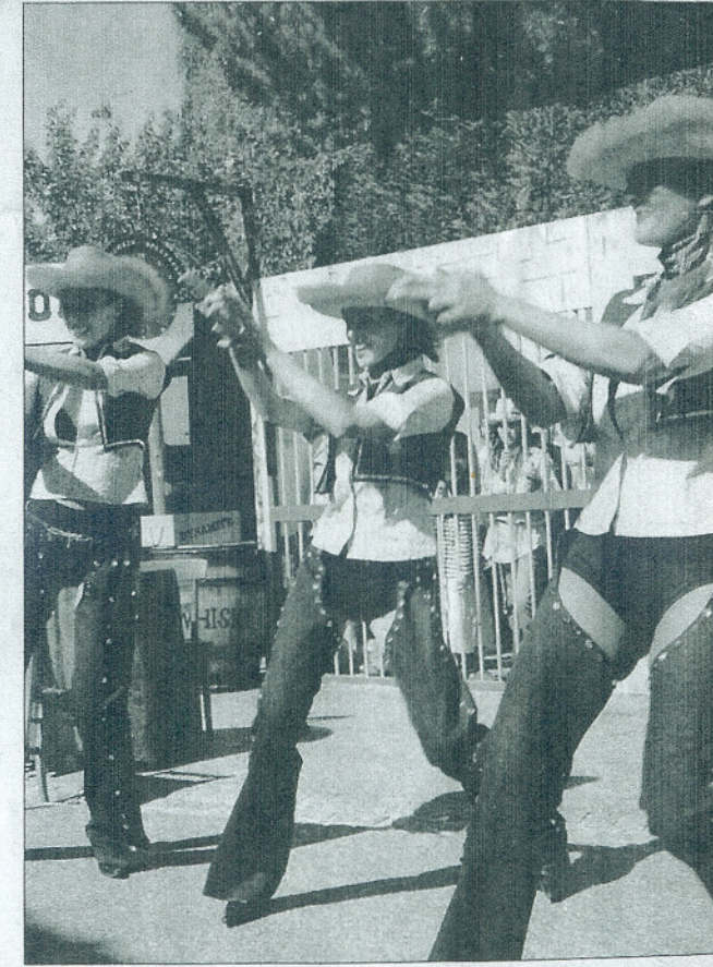
Devant le saloon. Il n'y a pas que dans la prison que règne l'agitation... Les pétards sont à la fête. (DR)